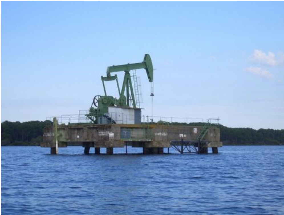
Photographie 2 : Station de pompage pétrolier à Parentis (Parentis oil pumping station.)

La ressource en tant que telle du sous-sol peut également être valorisée en termes de valeur patrimoniale. Ainsi, à Parentis, qui connaît une exploitation pétrolière depuis les années 1950 (Di Méo, Houtmann, 1973 ; Enjalbert, 1957), l'exploitation est décrite comme patrimoniale par l'exploitant, lequel évoque même une « certaine fierté à revendiquer qu'il y a une activité pétrolière sur le territoire » (entretien avec l'exploitant pétrolier).