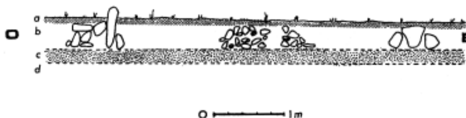
Fig. 2. Coupe suivant l'axe E.O. a: couche d'humus; b: couche de terre plus claire; c: couche de galets roulés; d: le poudingue délité sous-jacent.

Enfin quelques pierres, que l'on peut supposer de calage (à moins qu'elles ne soient "rituelles"), de même nature géologique, ont été disposées sans aucun soin entre les gros blocs, ou à leur face externe.