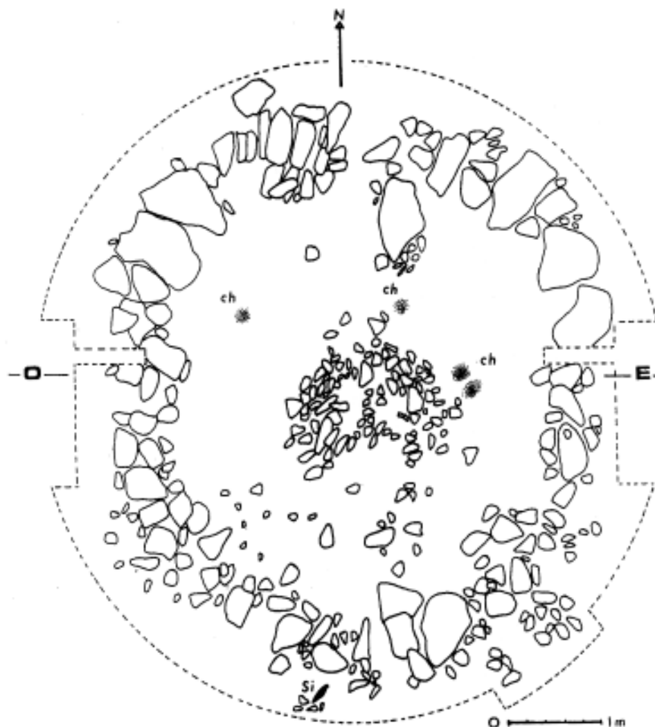
Fig. 1. Vue d'ensemble du monument, ch: charbons de bois - Si: lame de silex.