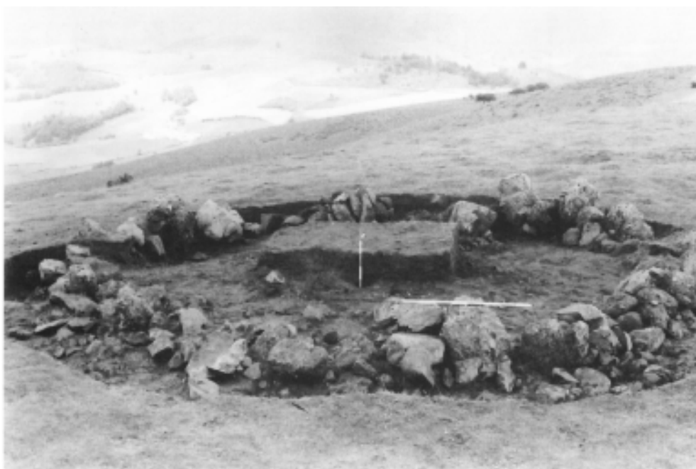
Photo 1: Vue d'ensemble du monument. Vue prise du Sud. Il persiste une partie de la banquette centrale.